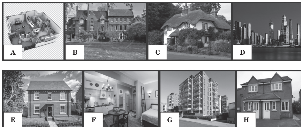
Рис. 1. Типы домов (“types of houses”)

В частности, такие задания, как лексические упражнения [4, с. 73–74], в том числе отраженные на рисунке 1.